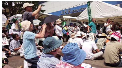
1800人が集まった川内駅前