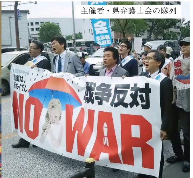
主催者・県弁護士会の隊列