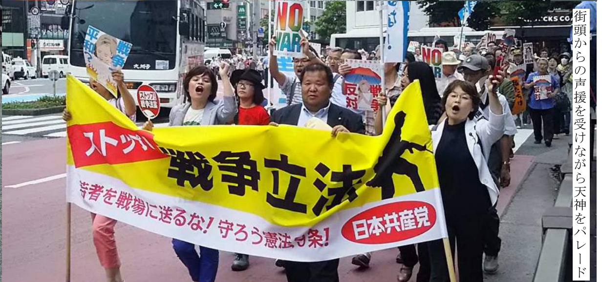
街頭からの声援を受けながら天神をパレード